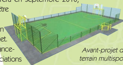
Avant-projet du terrain multisports

2009 et réfléchissent sur la mise en œuvre du prochain CEL. Meilleurs vœux à toutes et à tous et bonnes fêtes de fin d'année.