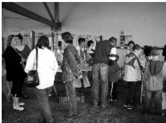
Marché de Printemps, le 24 mai 2008

Nous n'avons malheureusement pas bénéficié d'un temps clément pour le déroulement de notre marché de Printemps. Mais les parents qui se sont déplacés, ont pu admirer et acquérir les diverses réalisations des mamans et des papas qui ont à nouveau rivalisé d'idées pour proposer de superbes cadeaux pour la fête des mères.