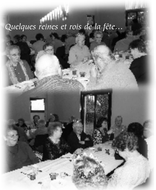
Quelques reines et rois de la fête...

Comme tous les ans au mois de janvier, l'A.D.M.R. a organisé la traditionnelle « galette des rois » et ce fût un moment très chaleureux et convivial durant lequel nous nous sommes retrouvés, bénéficiaires et bénévoles, plus nombreux que les années précédentes.