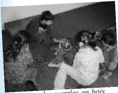
Avec des puzzles en bois

Une des classes de MS/GS et la classe de CP se sont retrouvés autour d'un projet commun : la découverte de l'œuvre de Gaston Chaissac. Le travail effectué en classe à partir de livres et de reproduction s'est vu enrichi par une visite au musée des Sables d'Olonne qui propose une présentation de diverses œuvres de l'artiste dans la galerie, des activités à partir de puzzles en bois et de coloriage. Les élèves ont découvert l'univers de Gaston Chaissac à partir de photos, les supports et les outils qu'il utilisait lors de la production de ses œuvres. Le projet s'est poursuivi à l'école par la réalisation et l'affichage de productions d'enfants à la manière de Gaston Chaissac.