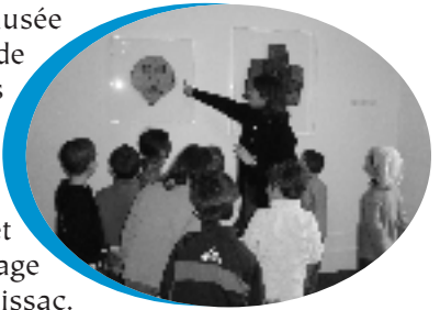
Autour des oeuvres