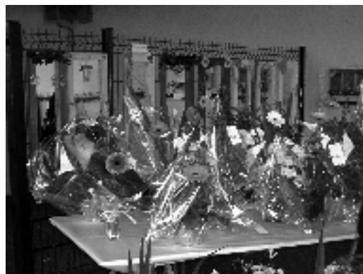
Compositions Florales et miroirs réalisés par les parents.

L'année scolaire s'est clôturée de façon festive. Nous avons pu assister au conte musical « Le Loup OK », un spectacle que les enfants ont préparé avec beaucoup