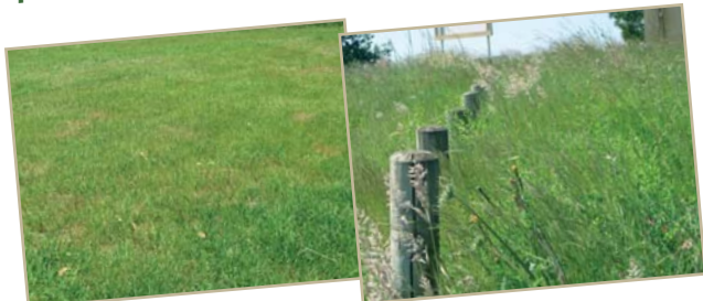
Trop court !

Non, l'herbe n'est plus à abattre à tout prix et ce n'est pas forcément de la mauvaise herbe !