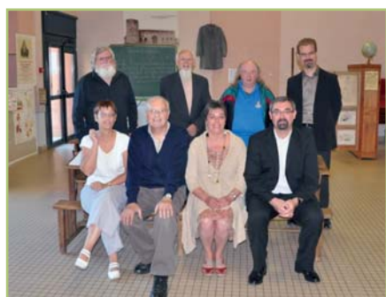
L'association « La Limouzinière d'Hier à Aujourd'hui »

Nouveaux habitants et « anciens » construisent ensemble leur histoire.