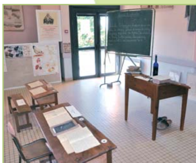
Reconstitution d'une salle de classe

Des interrogations sur l'identité et la période de fonction de certains instituteurs se sont précisées grâce à la mémoire infailible de nos visiteurs. Cela a donc contribué à enrichir le travail historique de départ.